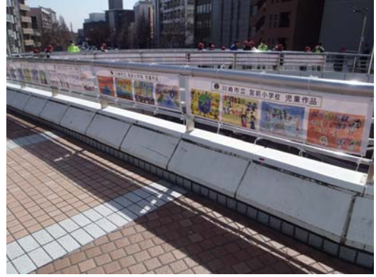
啓発絵画掲示完了後