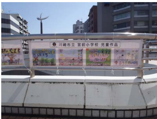
啓発絵画掲示完了後